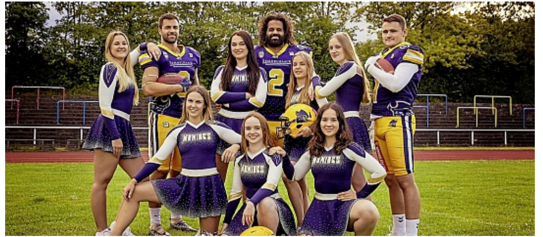
Two Sports - one Family.