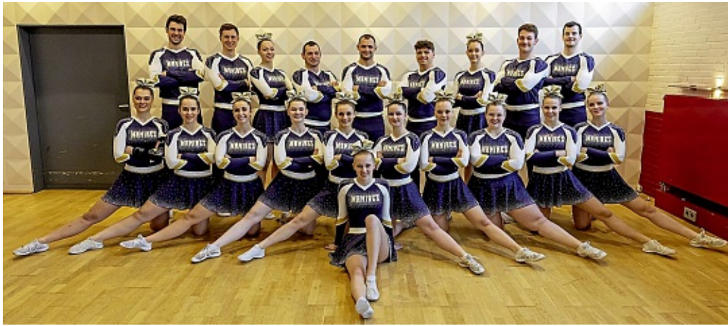
Die Major Maniacs bei der Regionalmeisterschaft 2024.