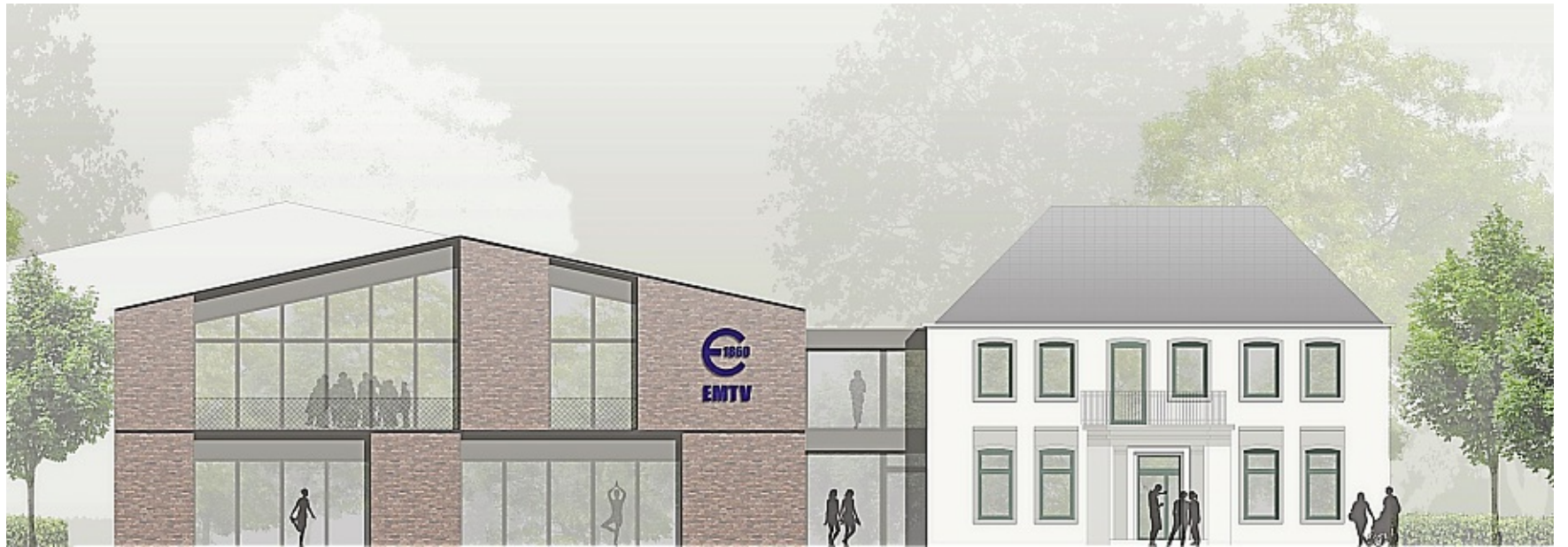
Ersatzneubau K1 Digital Ansicht Kaltenweide.