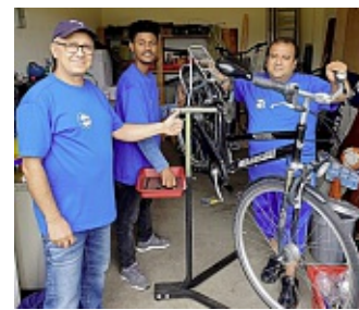
Die Schraubercrew des EMTV.

Was erwartest Du? Unterstützung bei Reparaturen und Wartung von Fahrrädern. Anleitung zur Selbsthilfe: Wir zeigen, wie's geht – und helfen, wo Hilfe gebraucht wird.