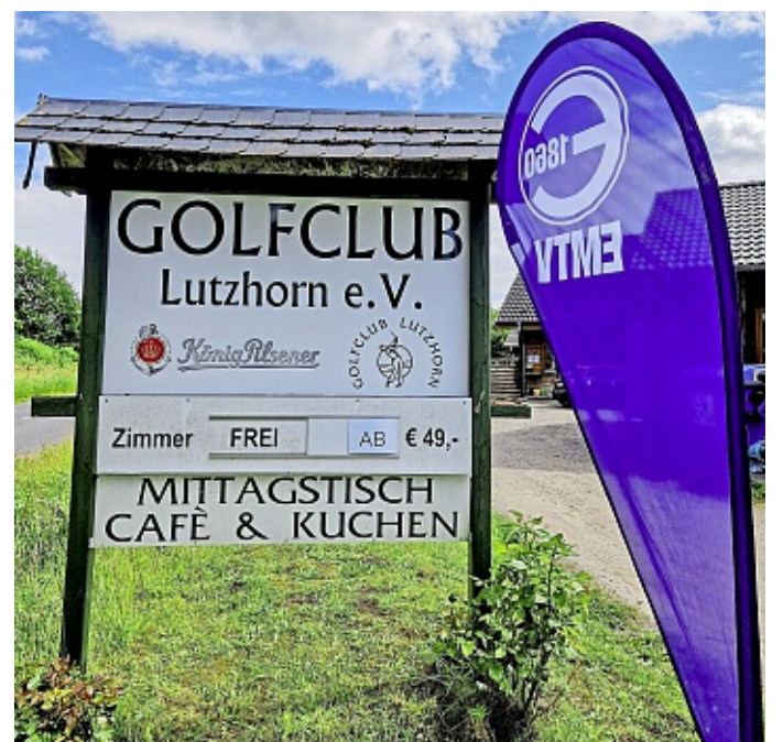
Kooperation: EMTV-Golfsparte voller Elan.

Veranstaltungsort: Golfclub Lutzhorn e.V., Bramstedter Landstraße 1, 25355 Lutzhorn