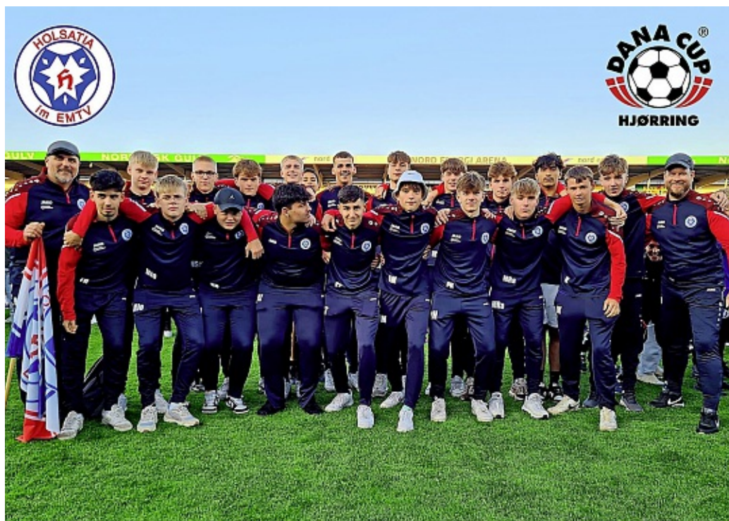
Die Vorfreude auf das Turnier im Sommer ist groß.

Holsatia im EMTV bedankt sich herzlich bei allen Förderern und freut sich auf eine spannende Turnierwoche in Dänemark.