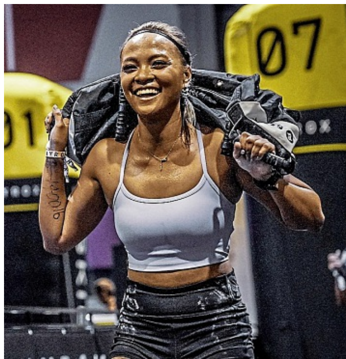
Auch Frauen wollen sich messen.