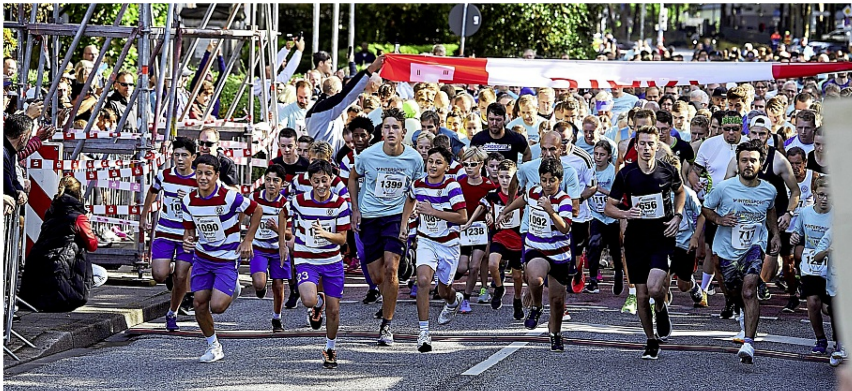
Zahlreiche EMTVer in der ersten Startreihe.