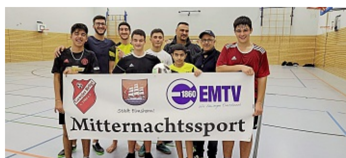
Voll dabei – frei und ungezwungen mit viel Spaß.