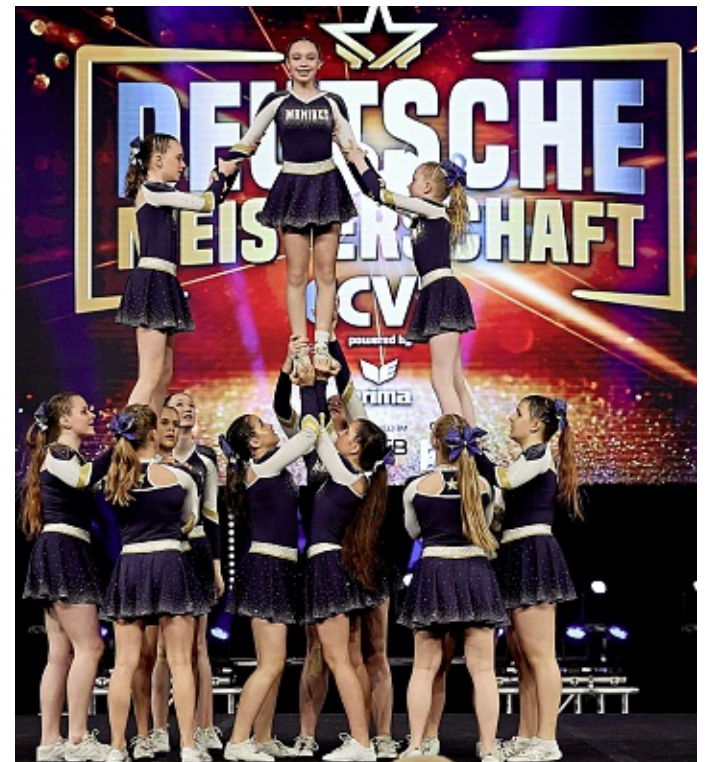
Die Magic Maniacs in den Top Ten Deutschlands.

Vielen Dank für eure Unterstützung! Gemeinsam machen wir 2025 zu einem unvergesslichen Jahr voller Spaß, Teamgeist und tollen Momenten.